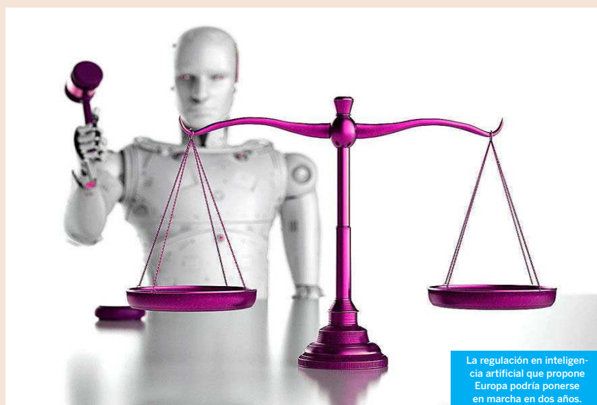
La regulación en inteligencia artificial que propone Europa podría ponerse en marcha en dos años.